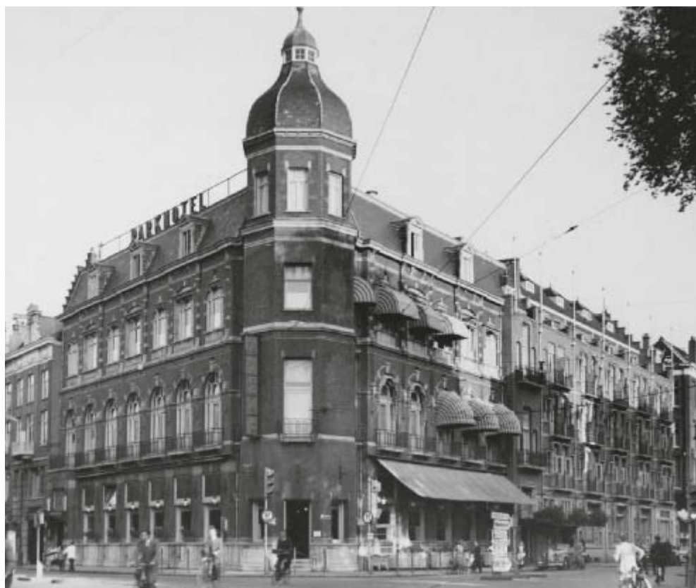
Het Parkhotel aan de Amsterdamse Hobbemastraat in 1941. Voor de zijvleugel in de Hobbemastraat staan Duitse richtingaanwijzers opgesteld.