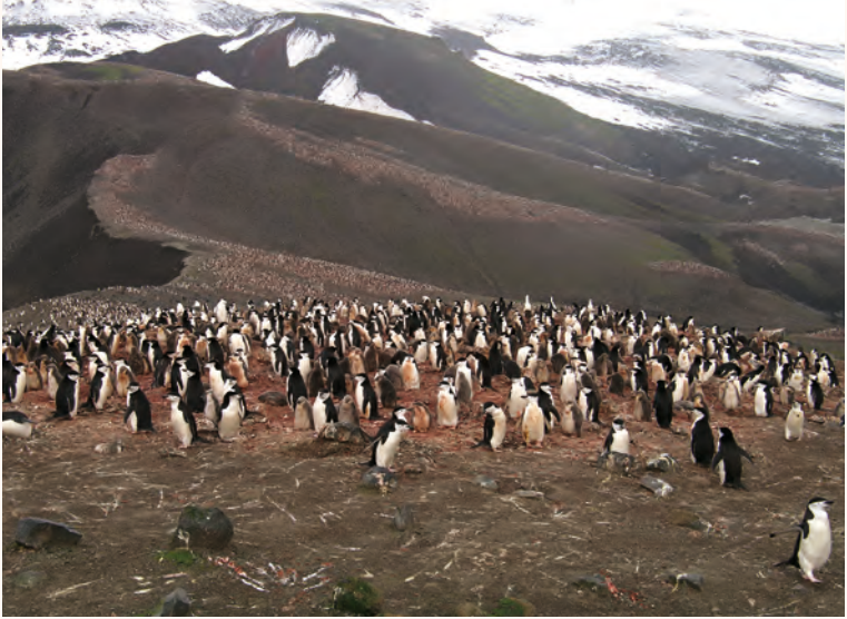
Baily Head aan de buitenrand van Deception

Verder landinwaarts zijn de ruïnes te zien van de Chileense basis Presidente Pedro Aguirre Cerda die bij de uitbarsting van 1967 werd verwoest.