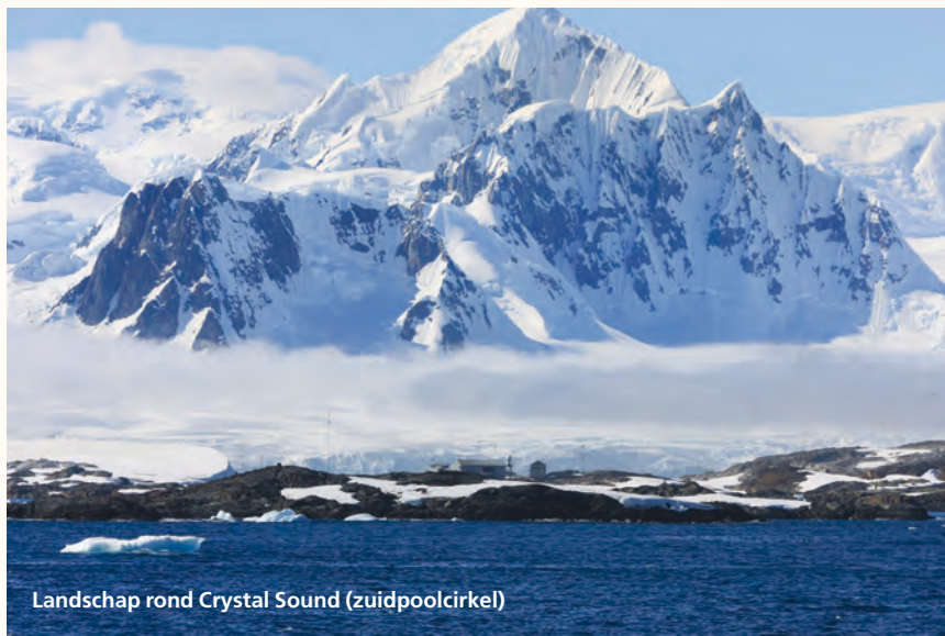
Landschap rond Crystal Sound (zuidpoolcirkel)

Dwars over het continent loopt een immense bergketen van meer dan 3000 km lang, de Transantarctic Mountains. De bergketen verdeelt het continent in Oost- en West-Antarctica. Oost-Antarctica is het grootste deel van het continent. West-Antarctica is slechts een klein deel, dat zich ook nog in noordwestelijke richting sterk vernauwt en zo het Antarctisch Schiereiland vormt.