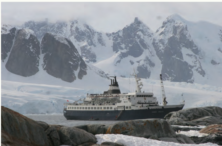
Een van de grotere expeditiecruiers, de Lyubov Orlova

De Falklandeilanden kunt u ook bezoeken zonder te varen. U kunt er vanuit Chili naartoe vliegen en verblijven op verschillende locaties.