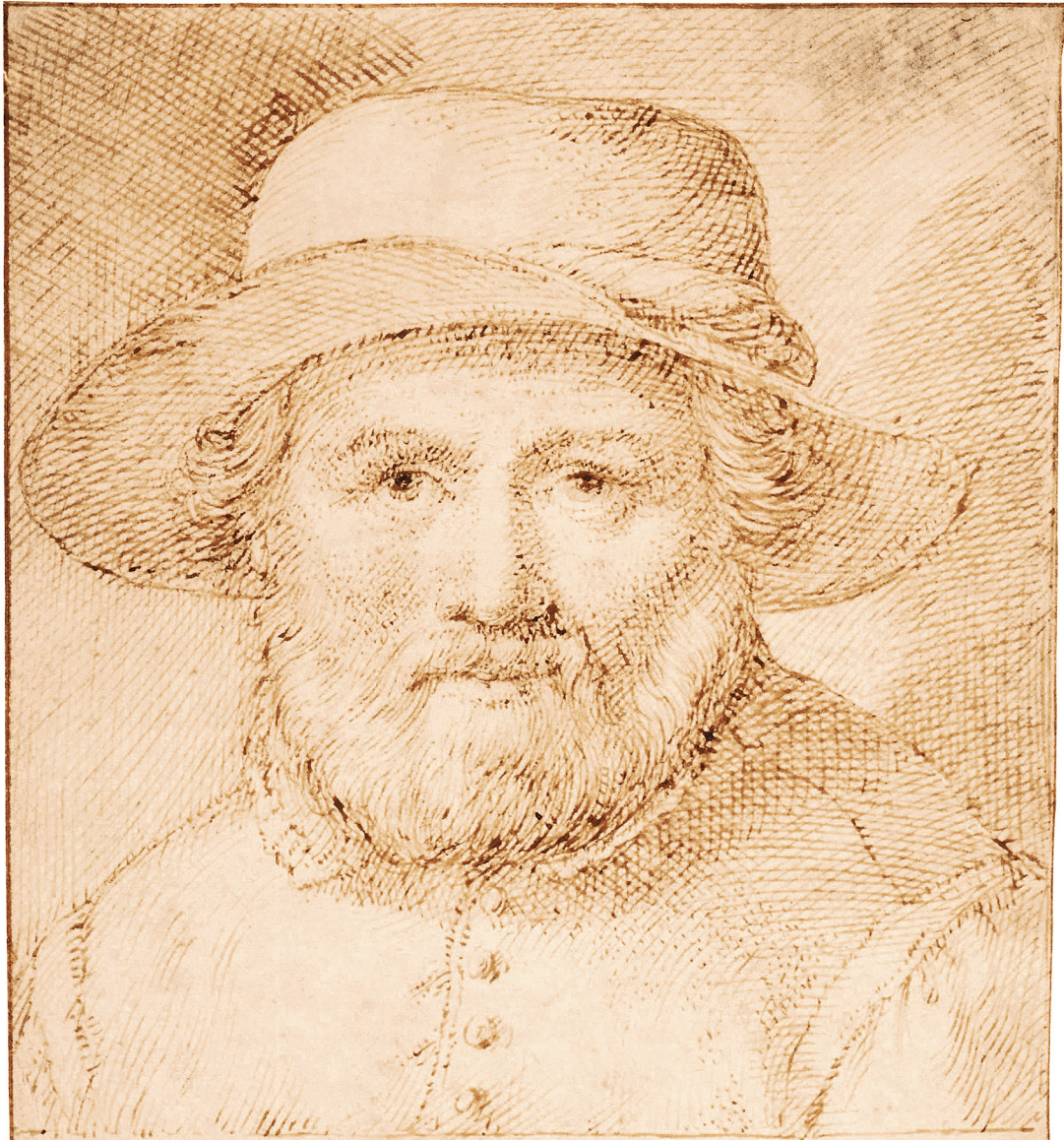
Dirick Volkertsoon Coornhert